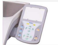
Panel de Comando PAD