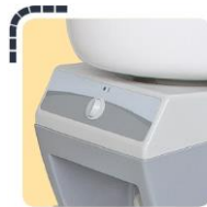
Calefacción de agua