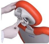
Apoyo cabeza biarticulado