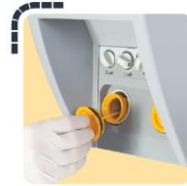
Filtro de residuos