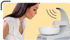
Sensor de Proximidad