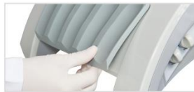
Soporte de piezas de mano extraíble