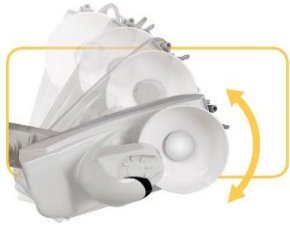
Unidad de agua plegable