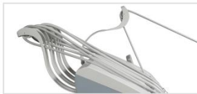
Sistema de Bloqueo de Varillas