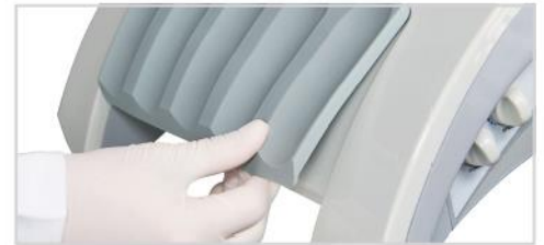
Soporte de piezas de mano extraíble y autoclave.