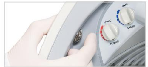
Accionamiento de la traba neumática situada bajo la perilla del módulo.